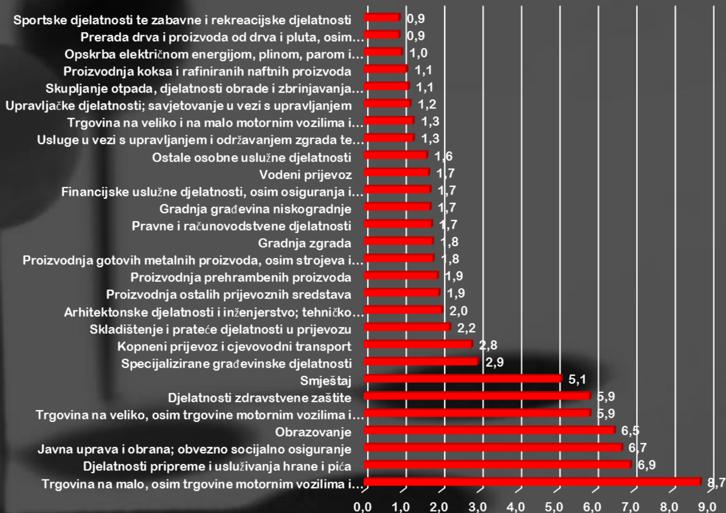
Zaposleni po djelatnostima 2015. %